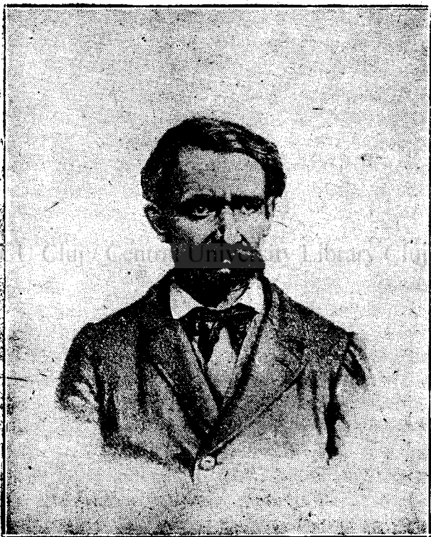
Avram Iancu în anul 1870.

vor cari se aflau pe atunci în Ardeal, — Nicolae Bălcescu, Cesar Boliac, Alecu Golescu și alții, și-au dat toate silințele ca să împace pe Iancu cu Maghiarii și apoi Iancu să treacă cu Moții săi în Muntenia, pentru a le salva situația. În 18 Ianuarie 1849 Alecu Golescu trimite din Zlatna o scrisoare mai lungă lui Iancu, la Câmpeni, comunicându-i în ea toate știrile primite