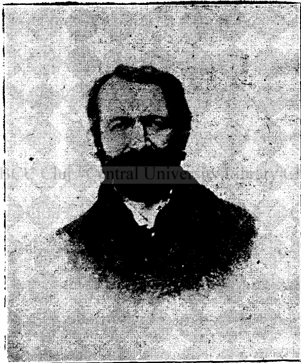
Avram Iancu în anul 1868.

Din inflăcăratul suflet de erou al anilor 1848—9 n'a mai rămas decât o umbră îndurerată, pribegind prin munți, fără a-și putea găsi undeva alinare. Aceste cumplite suferințe morale au făcut să sporească și mai mult popularitatea și faima numelui său de erou, iubit deopotrivă în culmea gloriei, ca și în adâncul întunecat al nenorocirei sale.