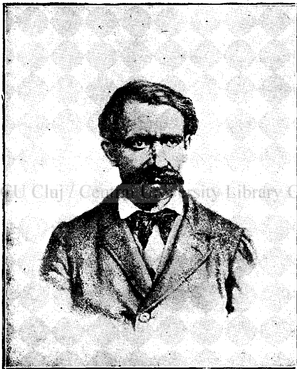
Avram Iancu în anul 1870.

trâna preoteasă după ea. Îmi spunea tatăl meu, că la fiecare popas mă-mă-sa trimitea oficerilor excortei câte un galbin, ca să mai ușureze soarta prizonierilor. Oficerii primeau bucuros banul, dar robii nu simțiau nici o schimbare în bine. Din Gherla, fiind goală și de bani și de alimente, bunica adânc măhnită trebuî în fine să se întoarcă acasă, iar tatăl și unchiul