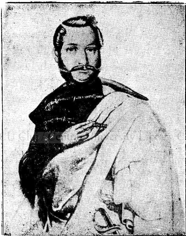
AVRAM IANCU după desemnul făcut de I. Costandea , Sibiu.

Adunarea (tinerilor din Târgu-Mureșului), după ce ascultă cu multă bucurie din graiul lui Birlea mișcările naționale din Blaj formă concludul următor că «pe Duminica Tomei după Paști toți tinerii câți se află în această mică adunare cu toți cunoscuții lor civili și preoți, intelectuali și țărani pe câți îi vor putea înduplecă să se afle în Blaj, unde aflându-se mai mulți