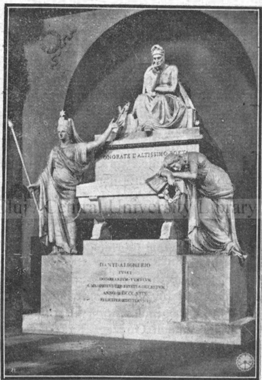
Monumentul lui Dante Alighieri din Firenze.

De-a dreapta poetului e chipul Italiei, arătând cu mâna spre poet și spre inscripția de pe chenotaf: « Onorate l'altissimo poeta ». La stânga e o figură ce reprezintă Arta Poetică, stând aplecată asupra cărții lui Dante: Divina Commedia, și ținând în mâna stângă o cunună de lauri.