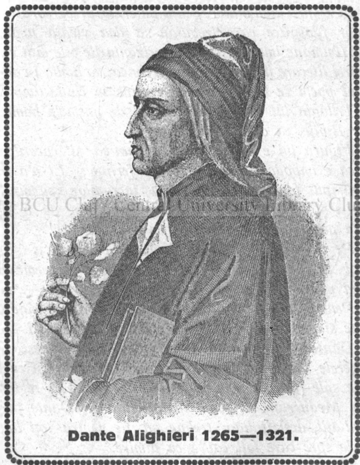
Dante Alighieri 1265—1321.

ÎNCHINARE cu prilejul sexcentenarului morții sale (1921).