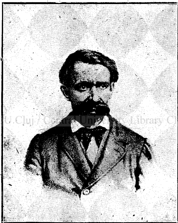
Fig. 6. Avram Iancu în anul 1870.

8. Bust luat în față. 1 Avram Iancu este cu capul gol, părul și mustățile mari, barba mare și neîngrijită. Ca îmbrăcăminte are un palton cu blană încheiat la piept, văzându-se gâtul puțin