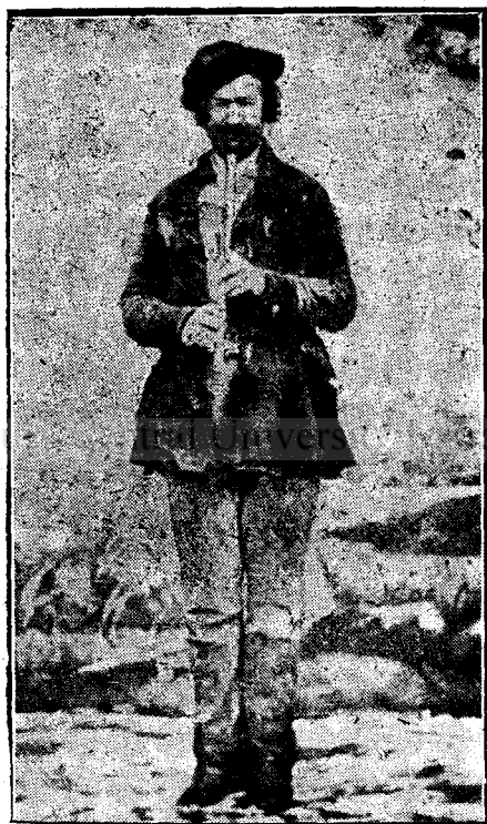
Fig. 7. Avram Iancu în anul 1872.

11. Avram Iancu în întregime luat în față. Este o caricatură în care îl reprezintă cu o pălărie mare pe cap, cu o mână în buzunarul pantalonilor și cu cealaltă se proptește într'un