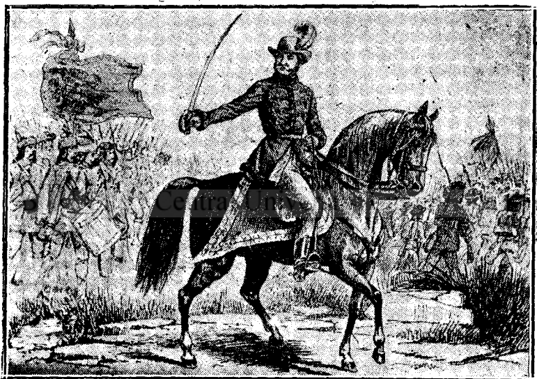
Fig. 3. Avram Iancu în mijlocul moșilor.

nița în spate. După el o altă trupă de Moși în marș cu steag și un toboșar bate marșul. Gravura este o fantezie, dar îmbrăcămintea și figura este identică ca la Nr. 3. Această gravură este reprodusă în mai multe cărți: 1. În «Familia» 1900 Nr. 4 pg. 41, litografie 18×12,5 cm. 2. La începutul broșurei «Biografia lui Avram Iancu» de Iosif Sterca Șuluțiu de Cărpeneș. Sibiu 1897, Zincografie 18×12,5 cm. 3. La începutul volumului «Poezii populare despre Avram Iancu» adunate și