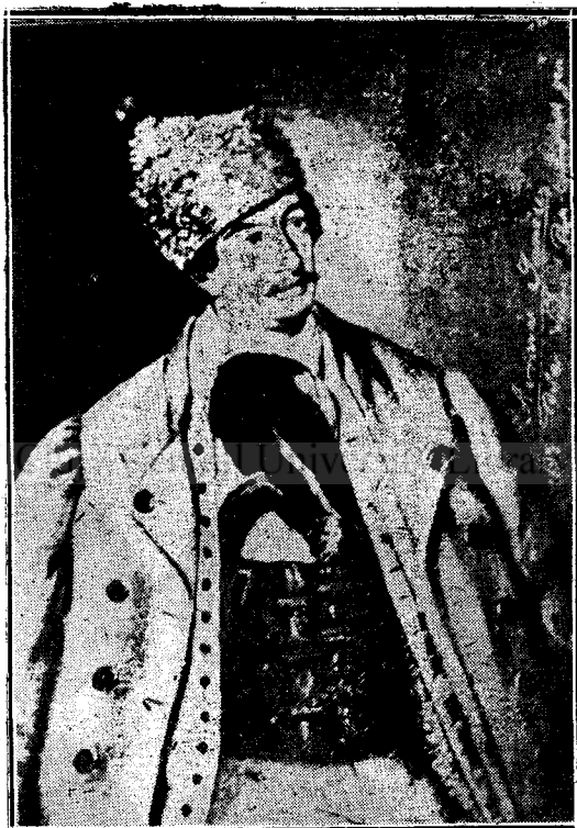
Fig. 1. Avram Iancu,

ale cărei fâșii sunt lăsate în jos. Peste cămașe este încins cu un șerpar lat în care sunt înfipte două pistoale și deasupra cămășii are un cojoc de oaie descheiat și peste cojoc o haină scurtă asemenea descheiată. Figura lui este rotundă, nasul și gura potrivite, mustățile mici și răsucite, ochii mari și privirea