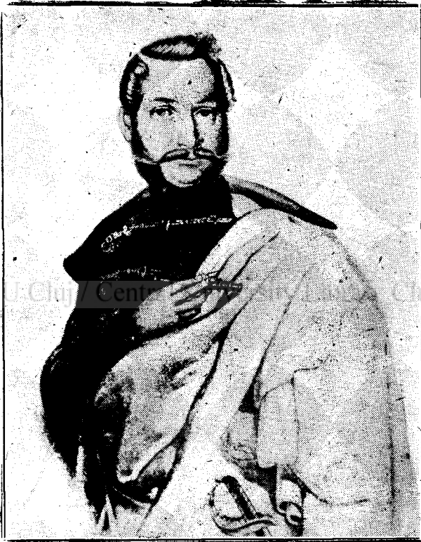
Fig. 2. Avram Iancu,

Cromolitografie 9,5×11,5 cm. făcută după cea de sus. B. A. R. Portrete. Nr. inv. 530.— A. VIII 63).