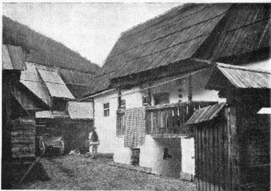
Fig. a) Casă din Rășinari (fața dinspre curte).

BCU Cluj / Central University Library Cluj