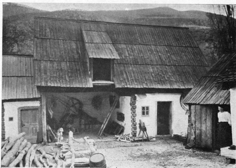
Fig. b) Șura cu grajdul și celarul.