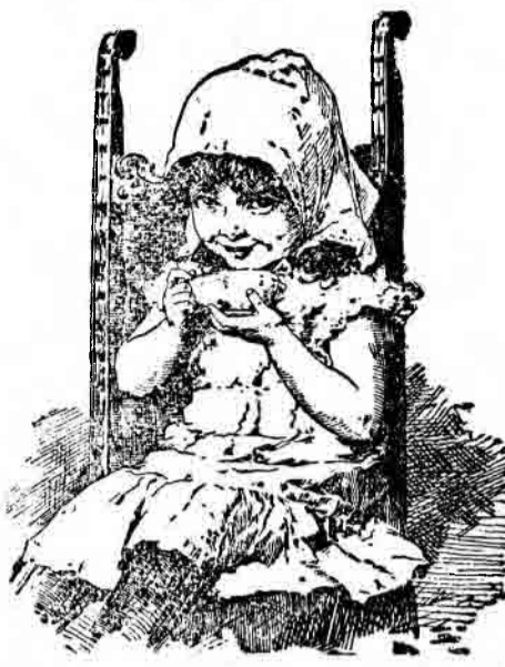
Mă-mi place mai mult!

Cine bea Kathreiner Cafeaua de maltă Kneipp