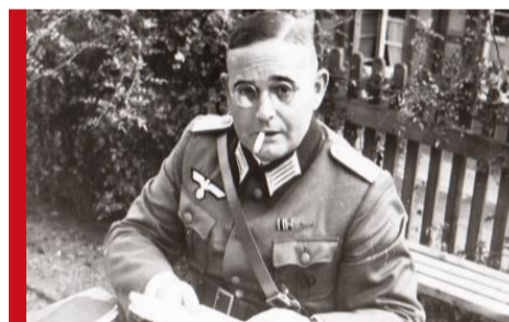
Heinrich Kempfe, în 1941

În calitate de ofițer de aprovizionare în cadrul Regimentului 158 artilerie Kempfe a luat parte la campania împotriva Franței și la invazia Uniunii Sovietice. În 1943, la vârsta de 47 de ani, el și-a încheiat stagiul de ofițer activ pe front, fiind transferat în orașul său de reședință Hamburg.